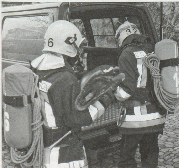
I pompieri di Sion in azione.