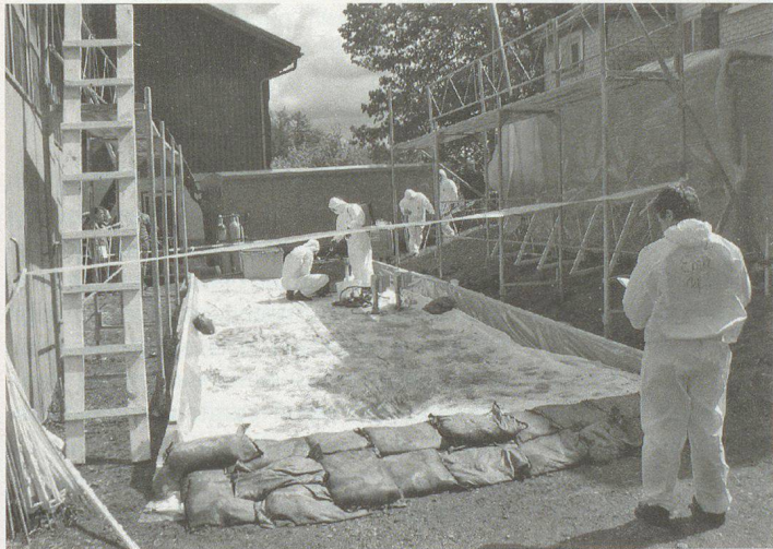
Einrichten einer Schleuse und Dekontaminationsstelle für Menschen und Fahrzeuge.