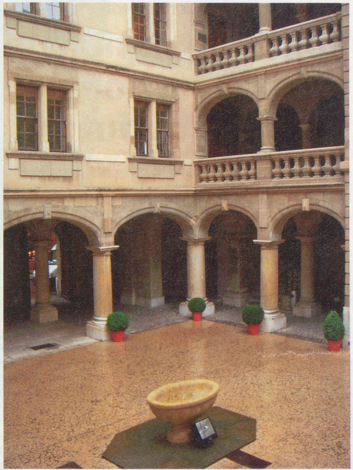
La cour de l'Hôtel de ville de Genève.