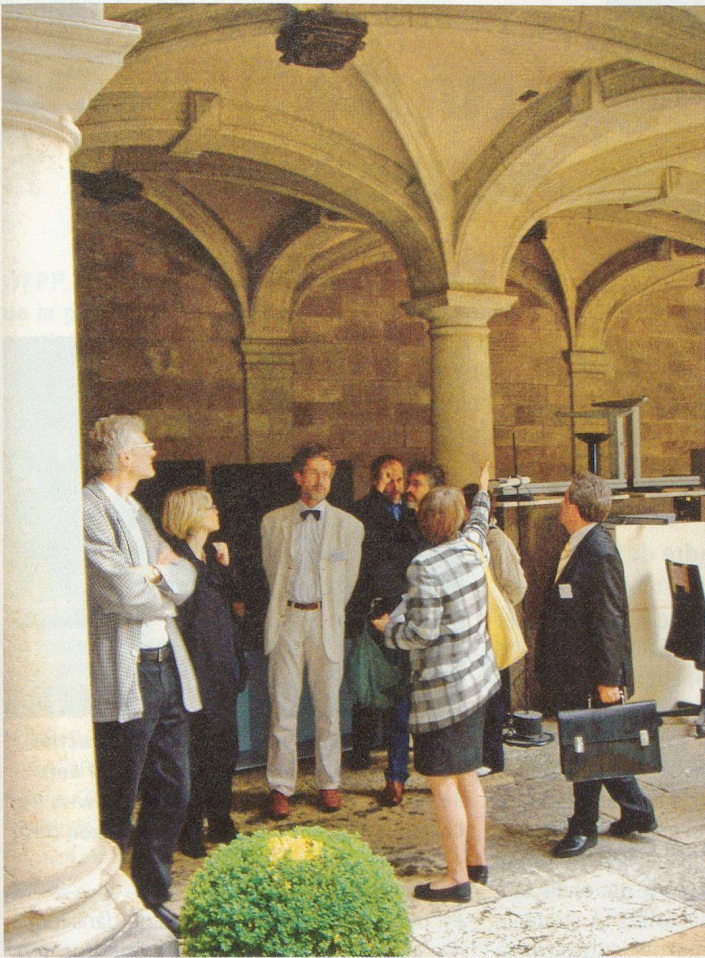
Membres du Comité suisse de protection des biens culturels.