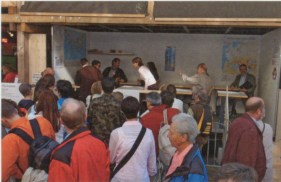
30 000 Besucherinnen und Besucher wagten sich auf den Erdbebensimulator.

In der ganzen Ausstellung wurden, wo immer es ging, die Besucherinnen und Besucher zum Mitmachen eingeladen, und auch die Kinder konnten sich spielerisch zum Beispiel mit Mitteln des Bevölkerungsschutzes vertraut machen. Durch das direkte Einblenden von Teilen aus der «Übung Rheintal» wurden der Bezug zur Praxis und der Verbundaufbau eindringlich dargestellt. Ganz im Sinne des Mottos, das BABS-Direktor Willi Scholl dem Anlass mit auf den Weg gegeben hatte: «Gemeinsam – nicht einsam». □