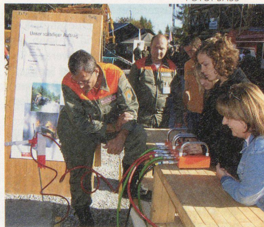
Wettbewerb am Zivilschutzstand.