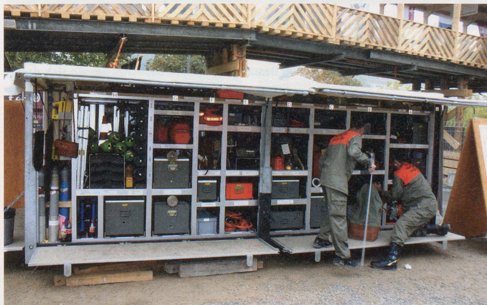
Fand viel Interesse: der Wechselladbehälter des Zivilschutzes St.Gallen.