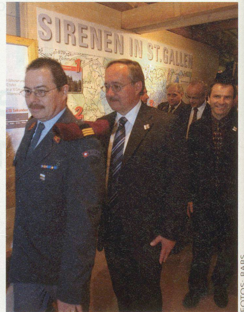
Bundesrat Samuel Schmid besucht den Bevölkerungsschutz.