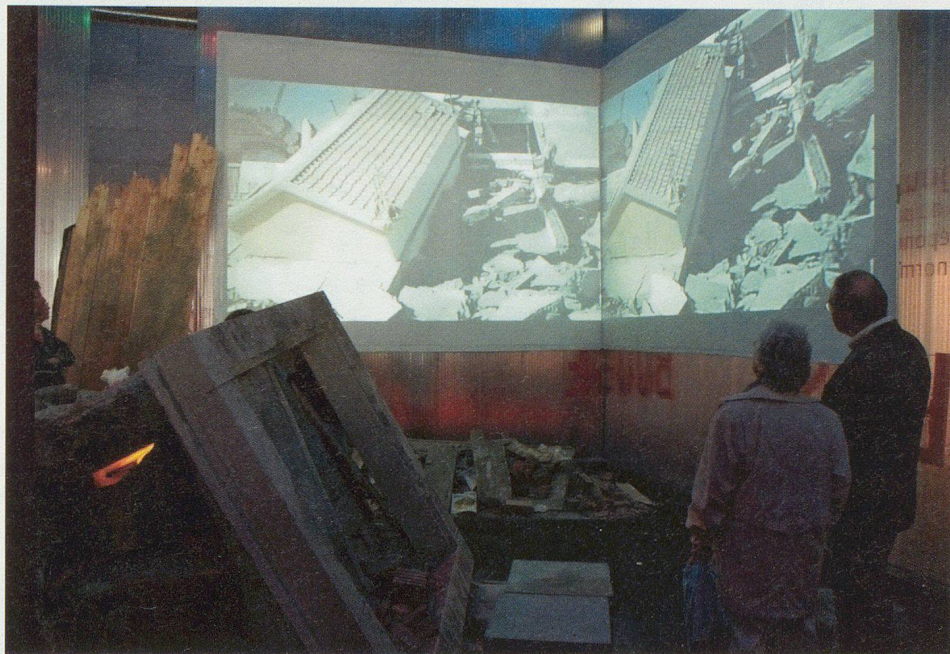
Les visiteurs ont été intéressés par les dégâts causés par de récents séismes.

par des mesures d'aménagement du territoire et, surtout, par une construction (voire une transformation des bâtiments actuels) de type parasismique. Le Valais est pionnier dans le domaine, puisque sa nouvelle loi sur les constructions exige une construction parasismique de tous les bâtiments selon la norme SIA 261. □