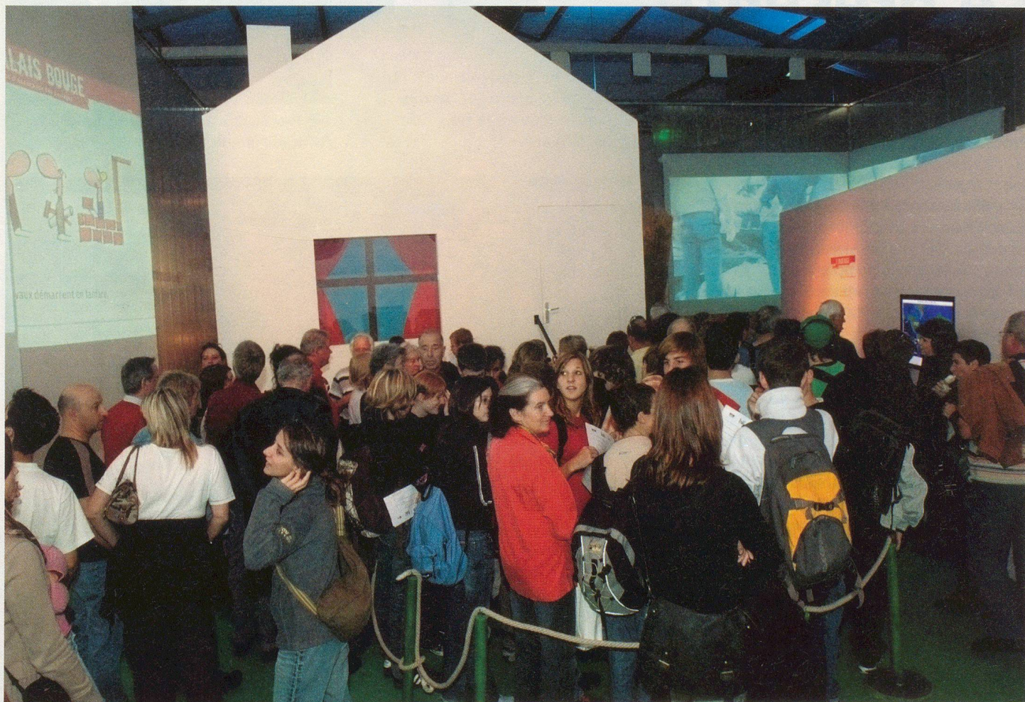
Jeunes et moins jeunes se pressaient pour attendre «la prochaine secouée».