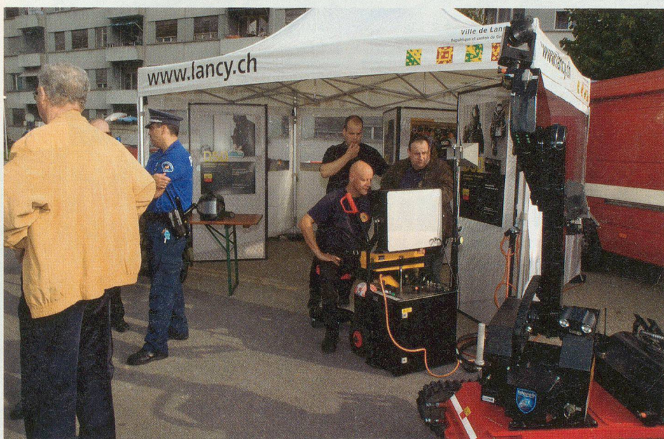
Démonstration d'un robot du Service de déminage du canton.