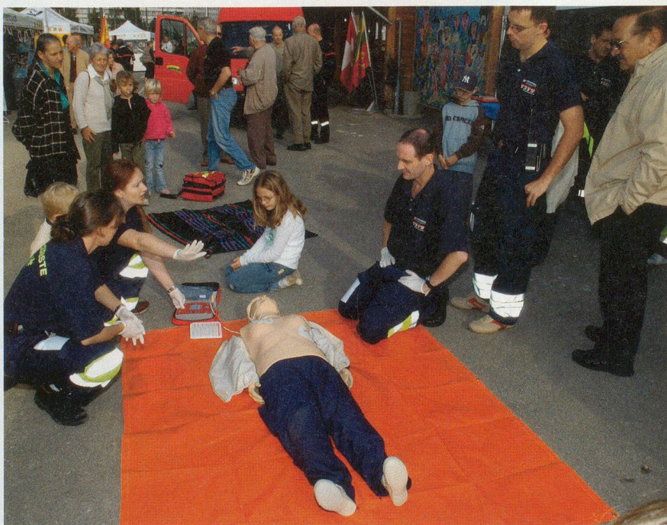
Une démonstration très convaincante des samaritains.