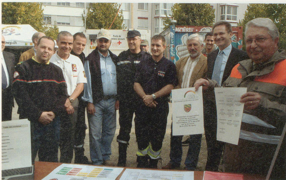
Tous les acteurs de la nouvelle convention liant les intervenants de la Sécurité de la ville de Lancy.