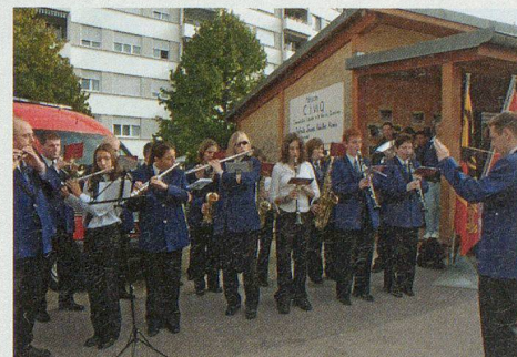
La musique municipale.