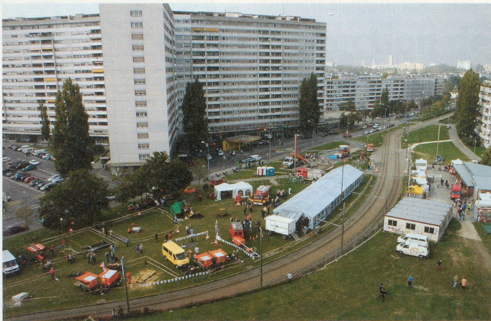
Une vue de la place de l'Esplanade (depuis la montgolfière).