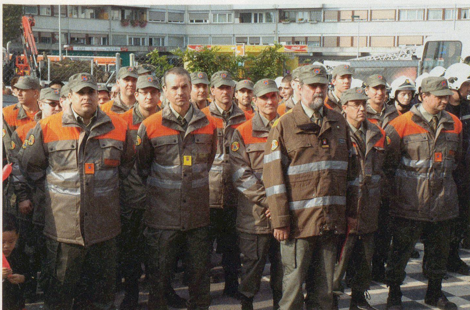
Tous les volontaires de la PCi pour cette journée.

s'associer, à se renseigner, voire à tester les différentes animations créées par le Groupement de sécurité.