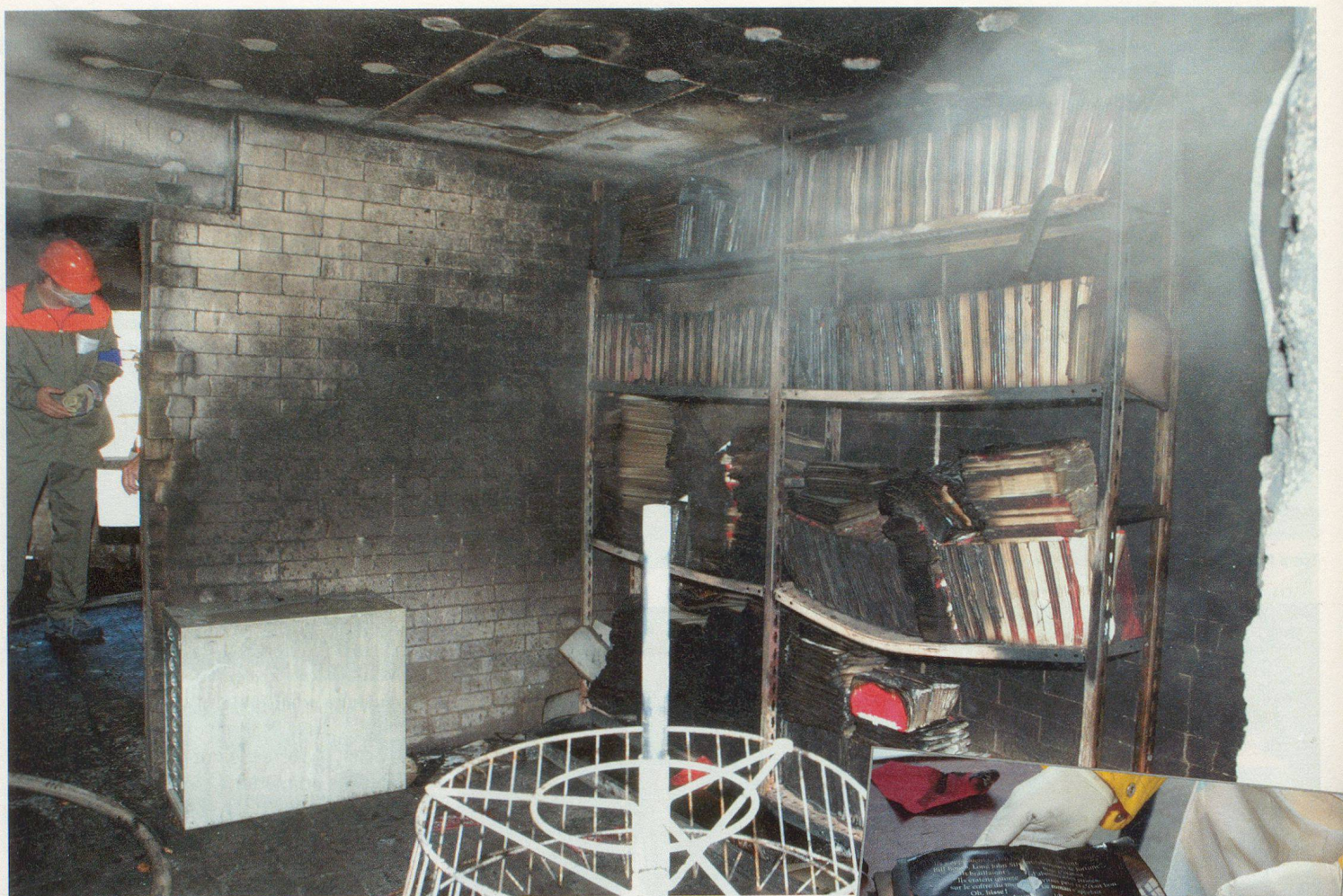
Premier constat après l'extinction de l'incendie.