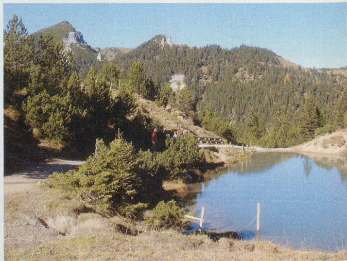
Malbun: Saas See.