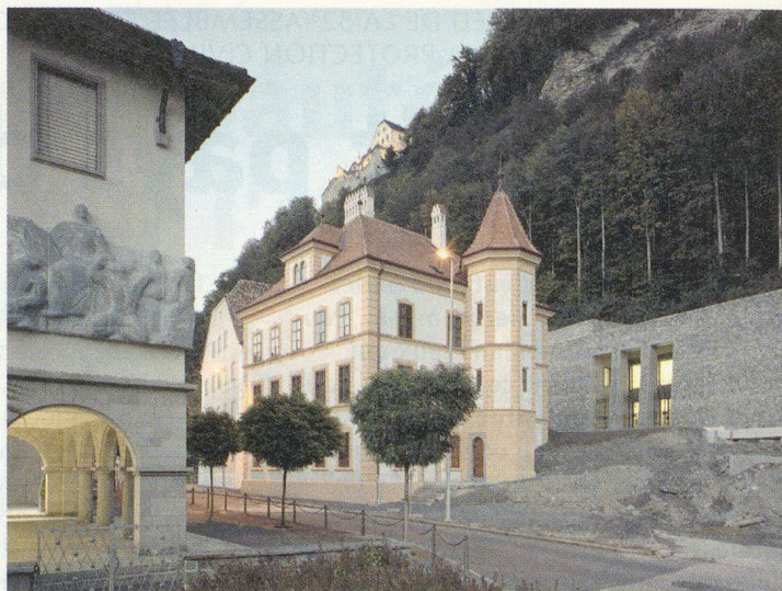
Le musée national à Vaduz.