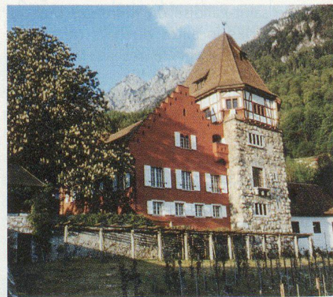
Vaduz: Rotes Haus.