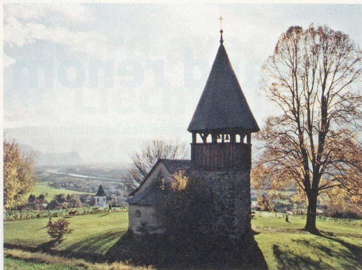
La chapelle de Mamerten à Triesen.