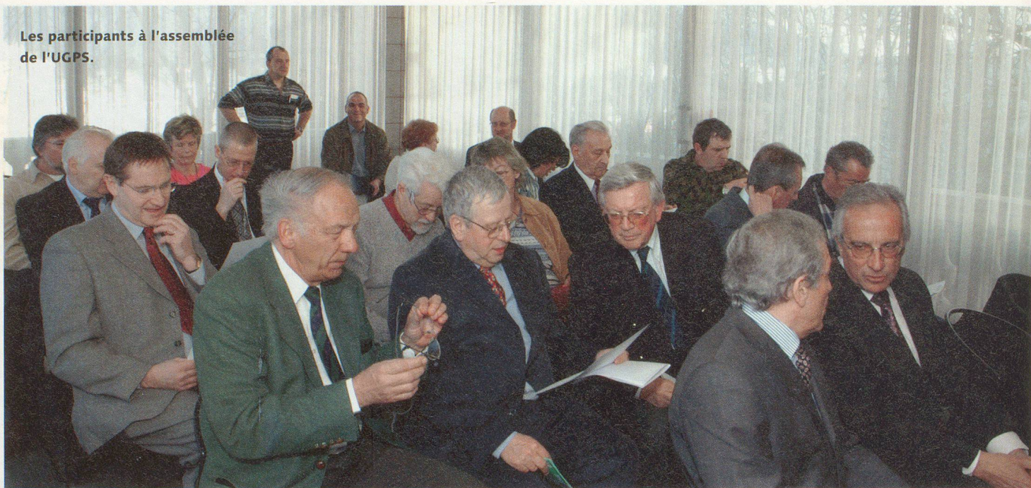
Les participants à l'assemblée de l'UGPS.