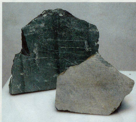
La pierre verte provient de la Vallée d'Aoste, l'autre de Bagnes.