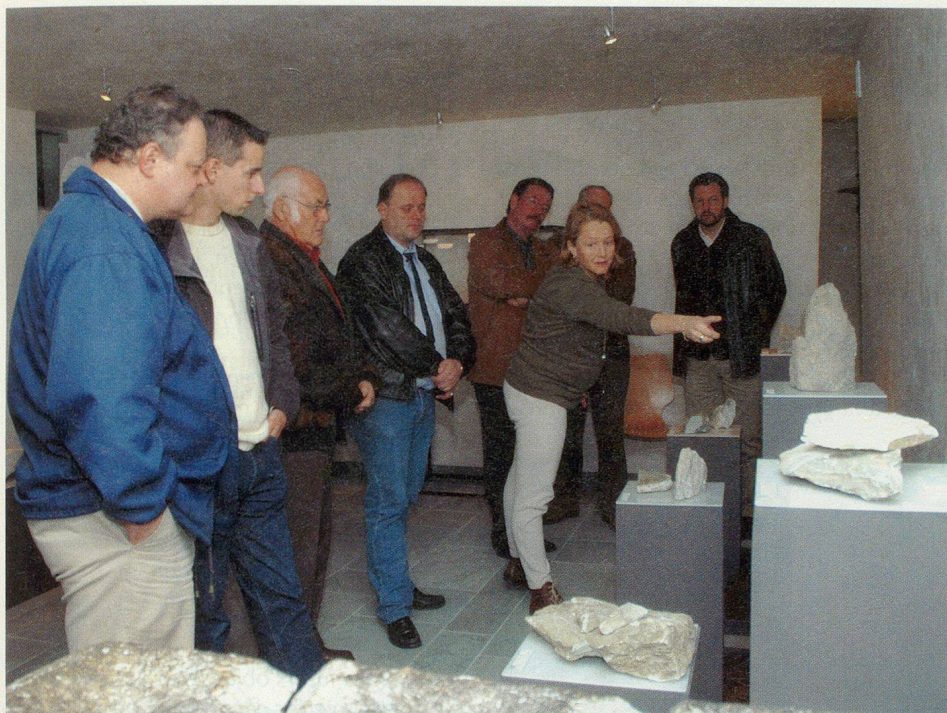
Visite guidée dans une des salles du Musée de la pierre ollaire.