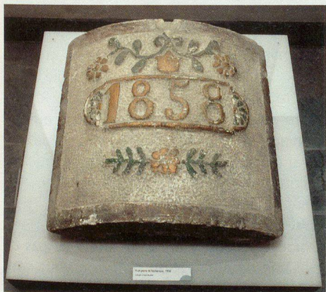
Une pierre taillée qui figurait sur un poêle.