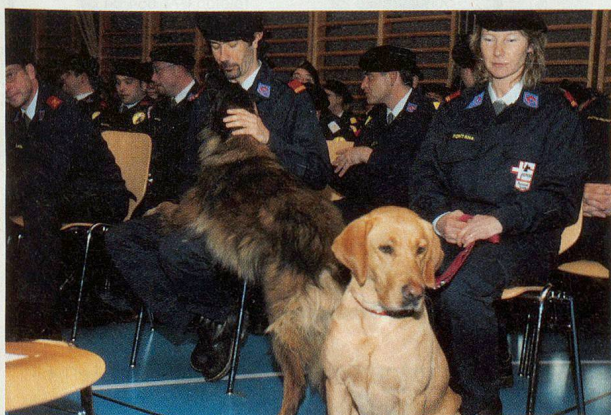
Une partie des chiens de la Redog.