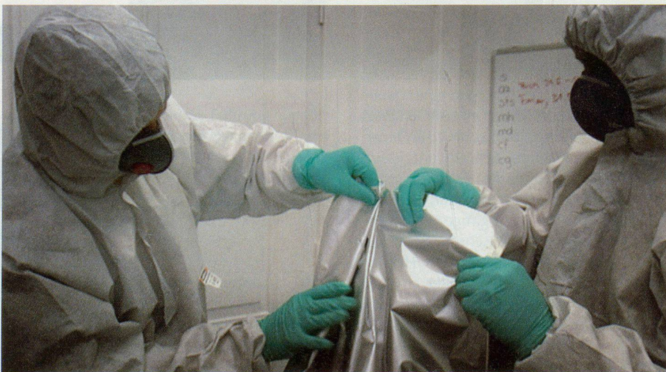
Speziell ausgebildete Einsatzkräfte der Polizei stellen eine verdächtige Probe sicher. Anschliessend wird sie ins LABOR SPIEZ gebracht und dort analysiert.