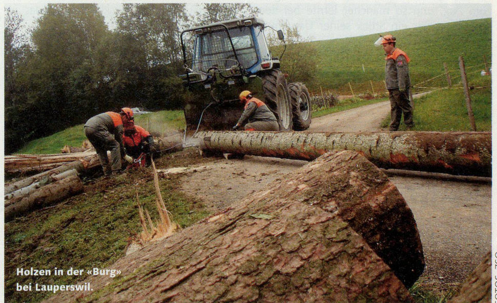
Holzen in der «Burg» bei Lauperswil.