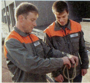
Ein Telematiker unterrichtet Knotenkunde in Langnau.

anlage am Langnauer Bleichweg assen bis zu 100 Leute. Beim «Riz Casimir» beispielsweise bedeutet dies, 20 Liter Suppe, 10 Kilo Kabisalat, 16 Kilo Reis, 17 Kilo Pouletfleisch und über 20 Liter Currysauce zuzubereiten. Für den Material- und Mannschaftstransport