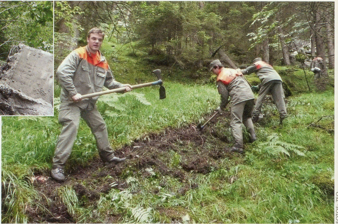
In teils unwegsamem Gelände zwischen Bristen und Silenen wird ein Weg angelegt.