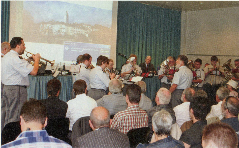
Das Zivilschutzspiel Solothurn umrahmt die Gründungsversammlung.