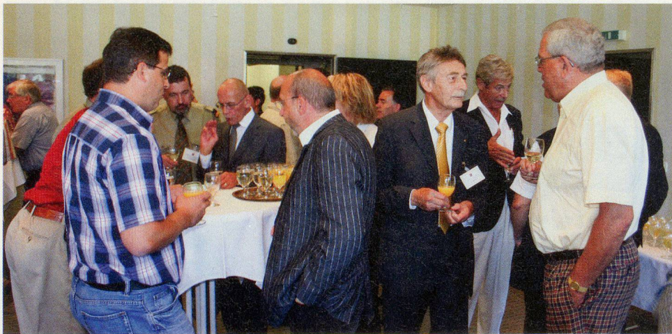
Fachgespräche nach der Stimmabgabe.

den Zivilschutz und die Zivilschützer in den Gemeinden einerseits und die Rechtssetzung und Unterstützung des Bundes «von oben» konzentrierend. Der SZSFVS vertrat damals, wie sein Name es sagte, mehr die Interessen der grossen Organisationen in Städten, für die sich andere Probleme abzeichneten. Seine Entwicklung bzw. Öffnung zu Gemeinden und Regionen mit mehr als 5000 Mitgliedern zeigt gleichsam den Weg, den der Zivilschutz im Rahmen des Bevölkerungsschutzes be- gangen hat.