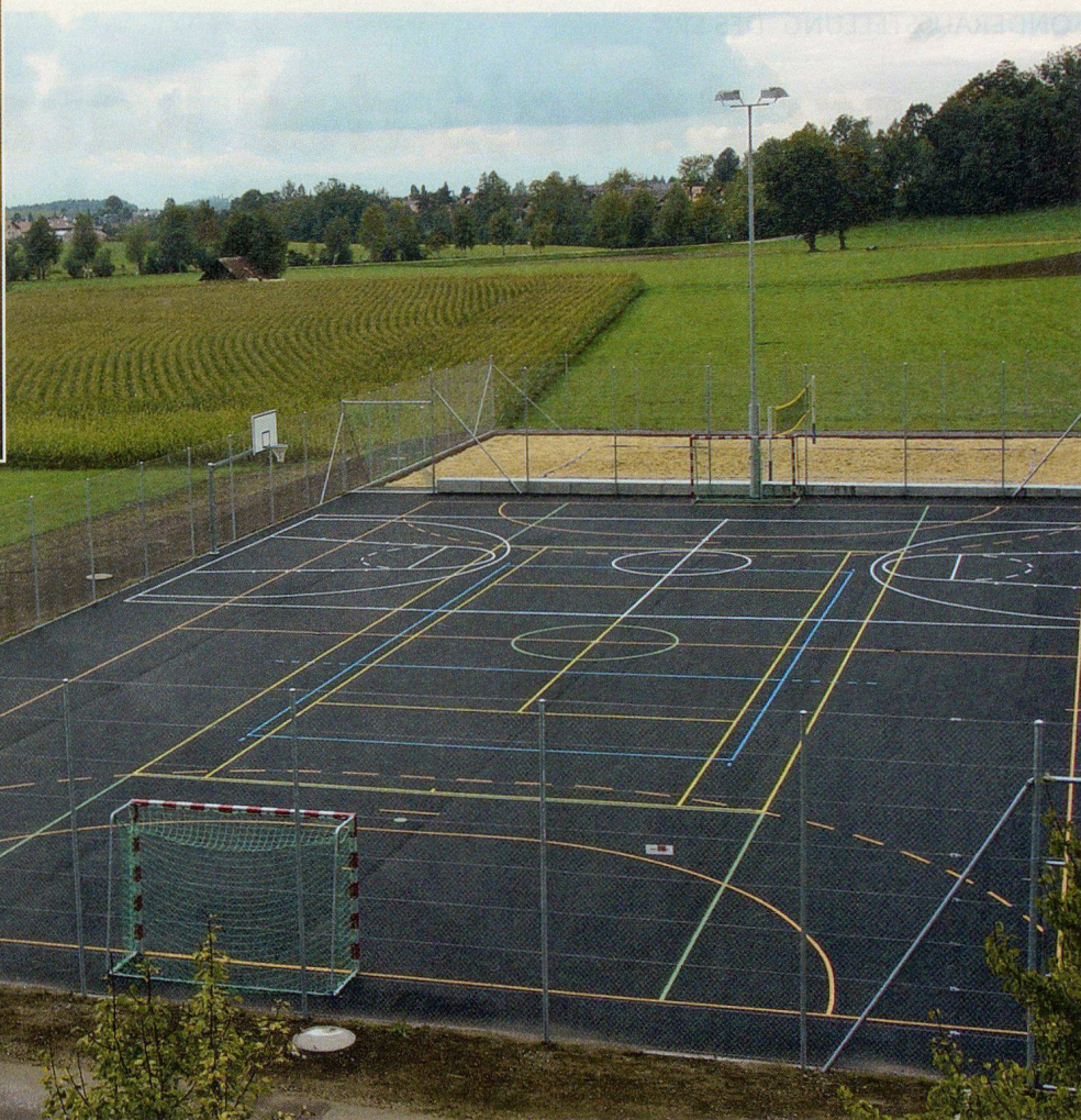
1500 Quadratmeter umfasst der neue Universalplatz des EAZS.