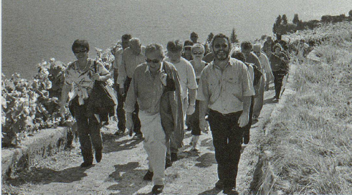
Konditionstraining beim Aufstieg.