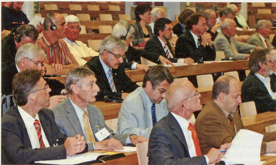
Die Delegierten stimmen allen statutarischen Anträgen zu und heissen den neuen Kurs in Richtung eines einzigen Schweizerischen Zivilschutzverbandes gut.