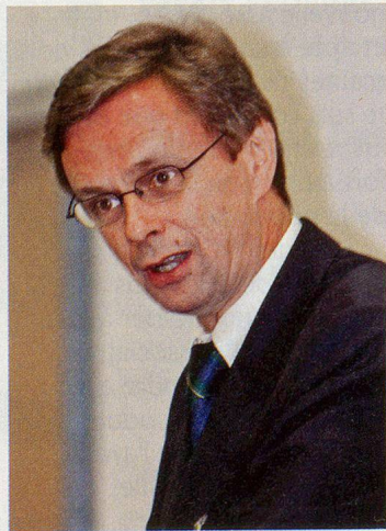
Regierungsrat Hans-Jürg Käser: «Katastrophen lassen sich nun mal nicht outsourcen!»