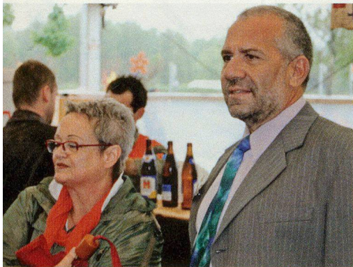
Nach der Delegiertenversammlung des Vormittags nehmen zahlreiche Delegierte und Gäste die Gelegenheit wahr, die eindrucksvolle Sonderschau des Zivilschutzes an der Frühjahrsmesse BEA zu besuchen.

JM. Am Samstag, 25. August 2007, vormittags, finden in Olten die beiden ausserordentlichen Delegiertenversammlungen von SZSV und VSZSO statt, mit anschließender Gründung des gemeinsamen, neuen Schweizerischen Zivilschutzverbandes. Bitte merken Sie sich dieses Datum vor.