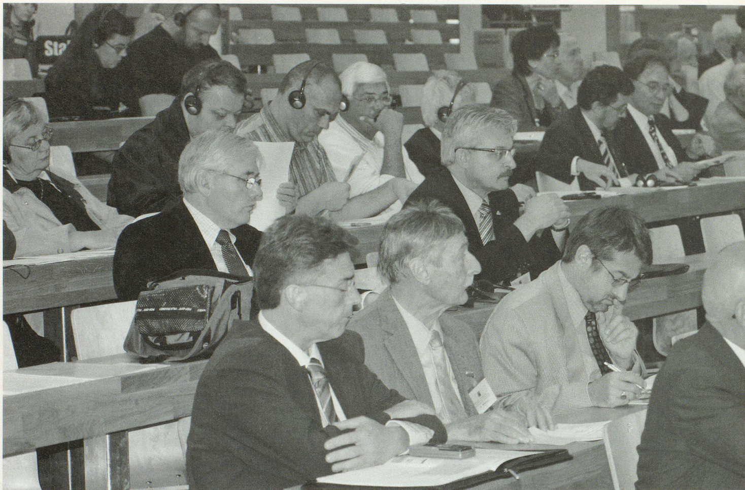
All'Assemblea 2007, i delegati si sono occupati praticamente solo del futuro dell'USPC.

BERNA: ASSEMBLEA DEI DELEGATI DELL'UNIONE SVIZZERA PER LA PROTEZIONE CIVILE