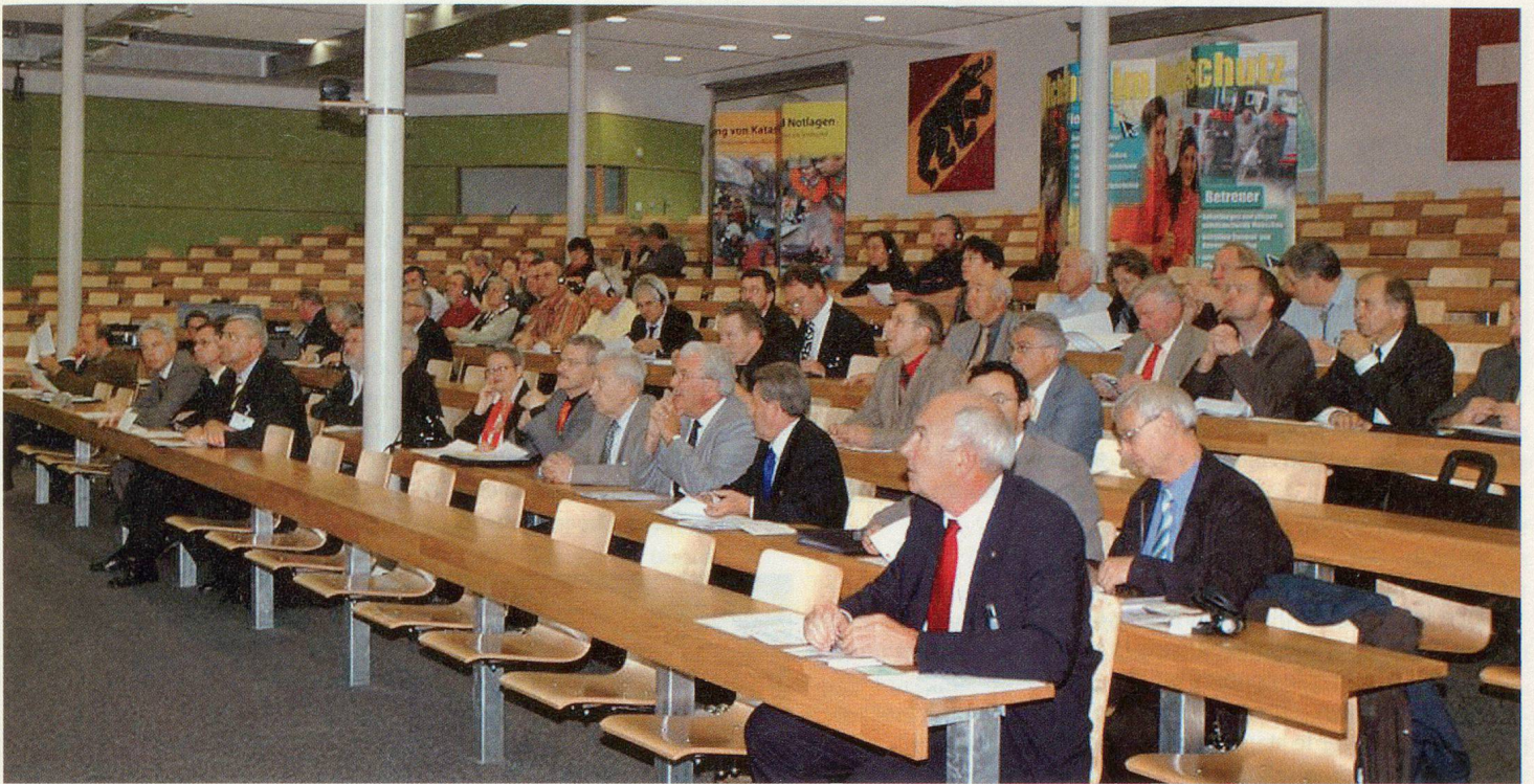
Une assemblée des délégués quelque peu «clairsemée».

53 e ASSEMBLÉE DES DÉLÉGUÉS DE L'USPC À BERNE