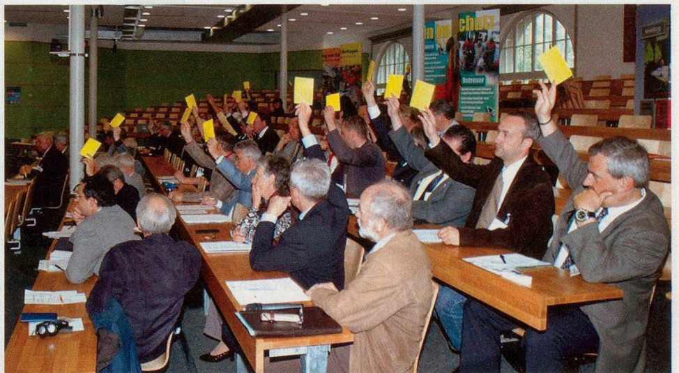
C'est «oui» aux comptes.

reste plus qu'à remplacer, dans la phrase, les mots la PCI vit et vivra pour lui donner sa légitimité dans les 26 cantons. Encore faut-il une substance et une volonté politique débarrassées de toutes idées de concurrence entre partenaires et de la détestable habitude