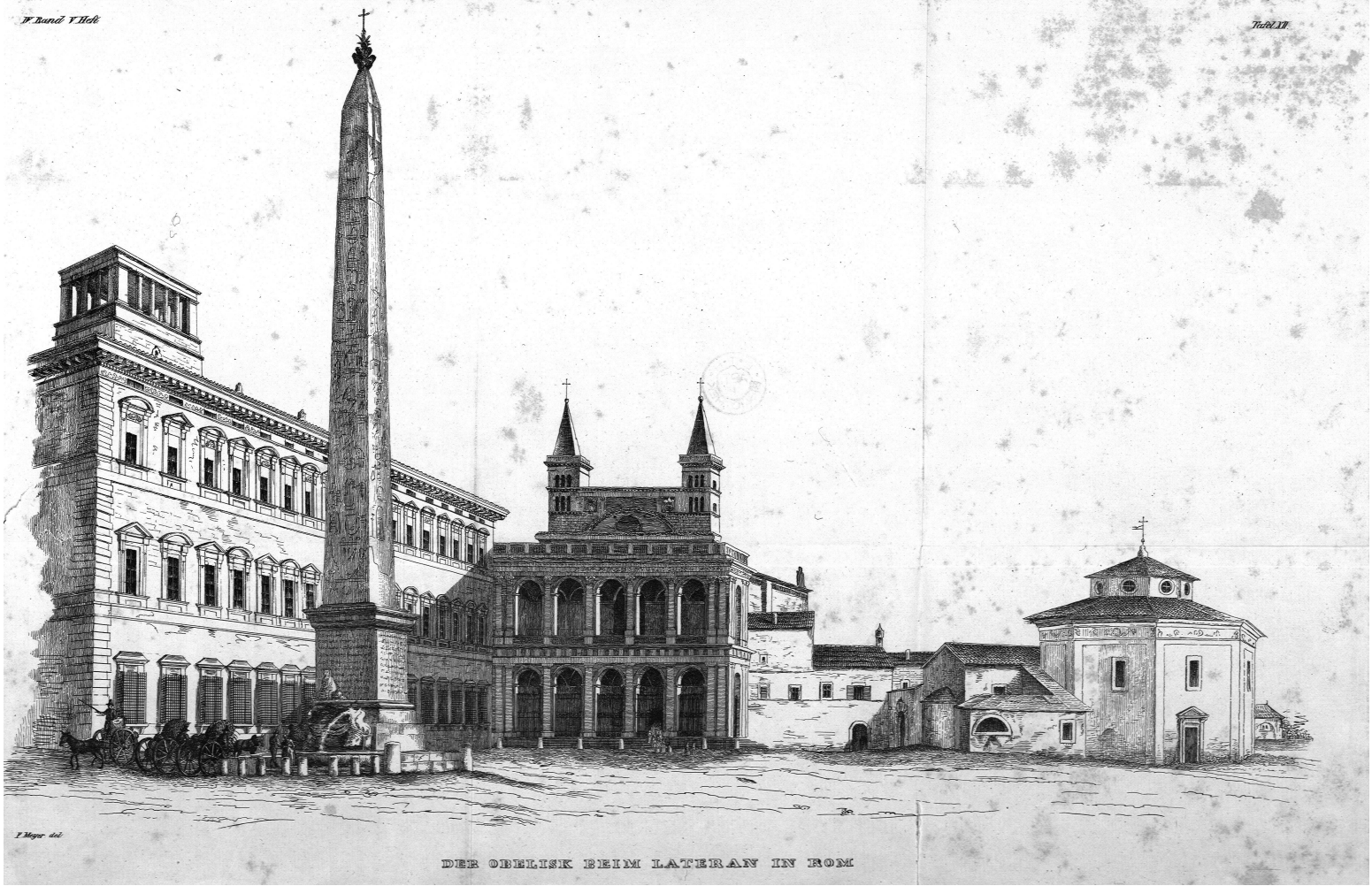
DER OBELISK BEIM LATERAN IN ROM