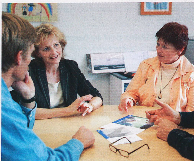
RENA TE WERNLI/ZETTLUPE

Kurs 261: DI, 16.30 bis 17.30 Uhr CHF 189.– (14x)