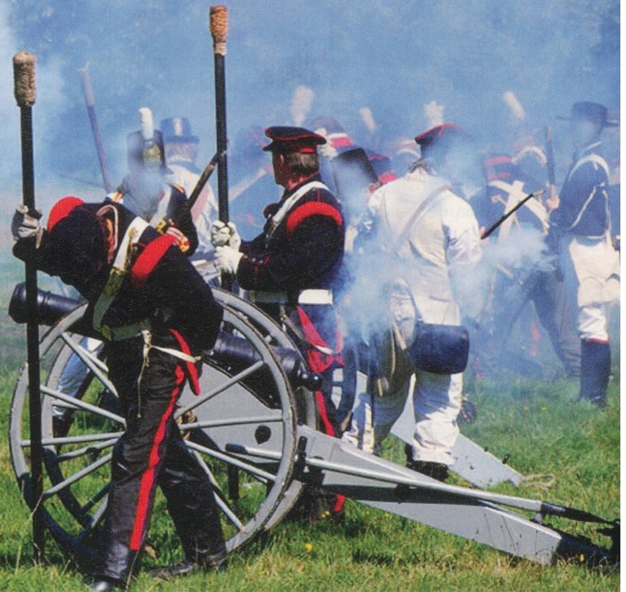
Napoleons Einfluss: Im Januar 1798 marschieren die Franzosen (Symbolbild aus einem Film) in Lausanne ein. Die darauf folgende Helvetik wird von Historikern als Scharnier-Zeit bezeichnet, da sie vieles vorwegnimmt, was erst 50 Jahre später realisiert wird.

Als Hauptstadt macht Luzern vor Bern das Rennen, mit 61 zu 57 Stimmen. Am 4. Oktober 1798 beginnt hier die erste Session des ersten frei gewählten Schweizer Parlaments. Die Stadt betreibt einen riesigen Aufwand: Die fünf Direktoren (heute: Bundesräte) logieren im ehemaligen Jesuitenkollegium. Jeder Direktor erhält 14 Zimmer und eine Küche. Der Senat (76) tagt im Rathaus und der Grosse Rat (152) im Jesuitenkollegium. Architekt Vogel aus Zürich plant im Mariahilf-Kloster ein neues «Capitol mit Terrasse und zwei prächtigen Säulenlauben». Um den Parlamentariern den Aufenthalt möglichst angenehm zu gestalten, werden Bälle, Theater und Konzerte veranstaltet.