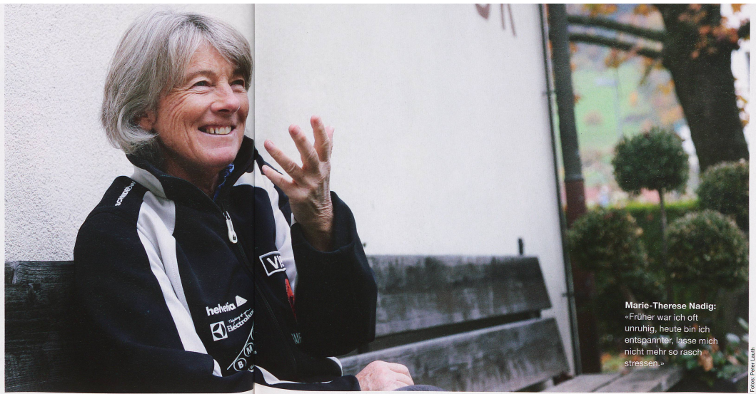
Marie-Theres Nadig: «Früher war ich oft unruhig, heute bin ich entspannter, lasse mich nicht mehr so rasch stressen.»

Sie sitzt da, rührt in ihrem Kaffee. Und spricht über sich so, wie wenn sie ihr Leben lang nie etwas anderes gemacht hätte, als nachzudenken und ihr Dasein zu reflektieren. Dabei ist sie alles andere als eine grübelnde Stubenhockerin. Marie-Theres Nadigs Gesicht sieht man an, dass sie eine ist, die viel draussen an der Kälte war. Keine, die ihr Leben in geheizten Studierzimmern verbracht hat. Ihre Sommerprossen und Fältchen sind so echt und unverblümt wie sie selbst. So erzählt sie auch von sich: kein Schönreden, keine Worthülsen, keine einstudierten Anekdoten. Dafür aber differenziert – und ehrlich.