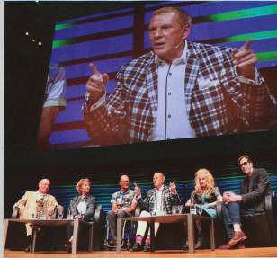
Moderator Kurt Aeschbacher inmitten der Talkrunde.