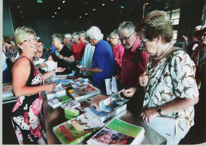
Begehrt: das neue Kursprogramm von Pro Senectute Kanton Luzern.