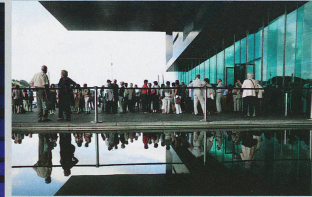
Der Anlass im KKL war wiederum ein Publikumserfolg.