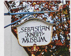
Oben: Sebastian Kneipps Lebenswerk im ortseigenen Museum Links: Kneipp-Armbad

Im Programm neben Bad Wörishofen auch Abano-Montegrotto, Montecatini und Ischia. Fordern Sie den Stöcklin Katalog 2017 unverbindlich an!