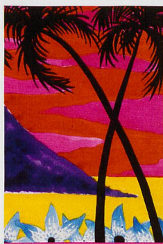
Claude Sandoz, The Pitons , Wasserfarbe auf Arches-Ingrespapier, 45,5 x 65 cm (Detail)