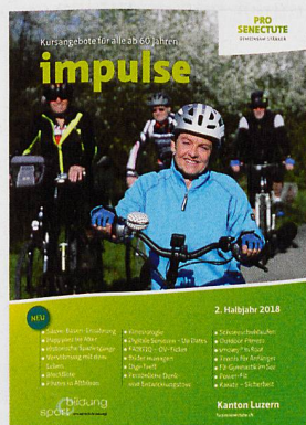
Bildung+Sport: Das neue Kursprogramm ist da.

Nach einer Stunde kribbeln die Finger, die Hände sind rosa. Ganz normal, sagen die anderen. Nicht nur die Finger sind angeregt, auch der Geist. Durch das Trommeln werde