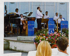
Oben: Das Kurorchester in Aktion Links: Der Rosengarten in voller Pracht

Stöcklin Katalog Im Programm neben Bad Wörishofen auch Abano-Montegrotto, Montecatini und Ischia. Fordern Sie den Stöcklin Katalog 2018 unverbindlich an!