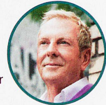
Moderation Kurt Aeschbacher