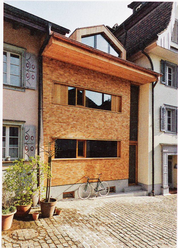
Architektur: Barmettler Architektur, Sempach

Dieser sorgfältigen, zeitgemässen Erhaltung und stilvollen Weiterentwicklung des historischen Ortskerns verdankt Sempach den Wakkerpreis 2017. Alt und Neu ergänzen sich hier ideal für eine sehr hohe Wohnkultur und Lebensqualität. Voraussetzung dazu ist eine breit verankerte Diskussionsfähigkeit über das Planen und Umbauen in der historisch wertvollen Gemeinde. Daher ist die kleine Stadt mit Kirchbühl und der Schlachtkapelle immer wieder einen Besuch wert.