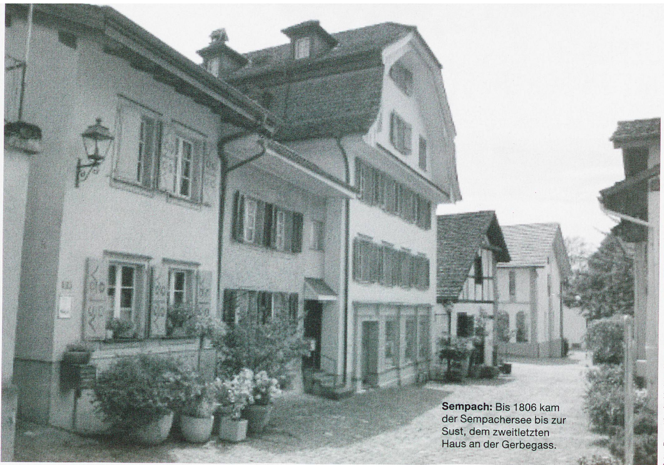
Sempach: Bis 1806 kam der Sempachersee bis zur Sust, dem zweitletzten Haus an der Gerbegass.