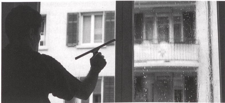
Integration durch Arbeit: Auch Winterthur will Teillohnjobs schaffen.

Nach der Stadt Zürich lanciert auch Winterthur ein Teillohnjob-Projekt. Im Rahmen eines Pilotversuchs sollen 10 bis 20 Teillohnjobs für ausgesteuerte Sozialhilfebezüglerinnen und -bezügler geschaffen werden. Die Stadt möchte diese Stellen direkt in der Wirtschaft ansiedeln und sucht deshalb die Zusammenarbeit mit Unternehmen. Die KMU-Vertreter haben sich bereits positiv zum Projekt geäußert und sind grundsätzlich bereit, solche Stellen zu schaffen. Im Endausbau soll es mindestens 100 solche Teillohnjobs geben, wobei der grösste Teil davon direkt von der Stadtverwaltung angeboten würde. (pd)