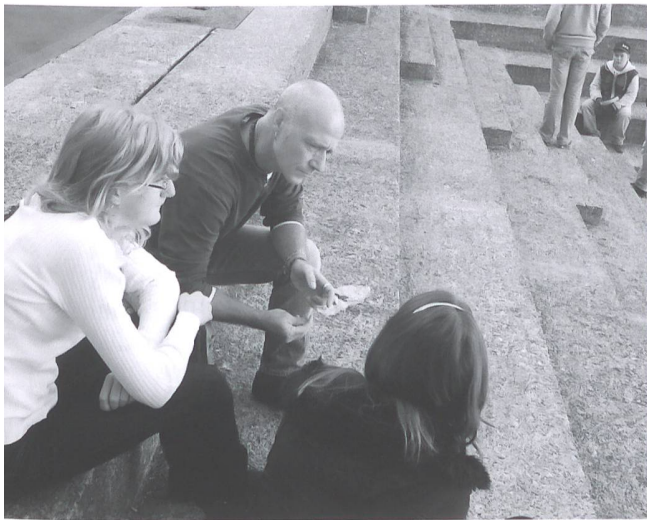
Er ist Vertrauens- und Autoritätsperson zugleich.