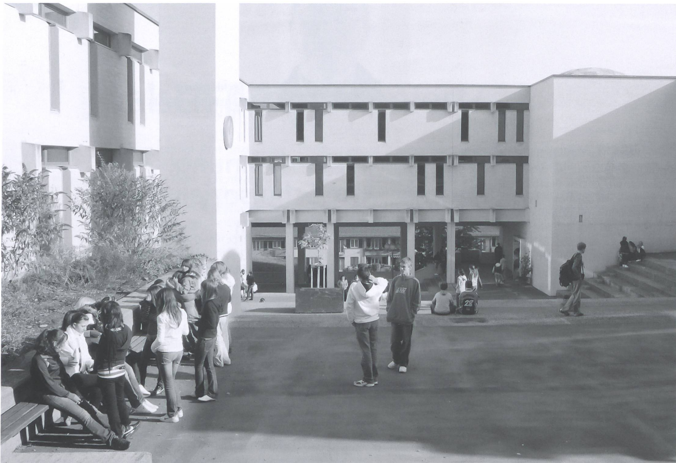
Pausenplatz in Zürich Stettbach: Rund 70 Prozent der Schülerinnen und Schüler, die hier ein- und ausgehen, sind ausländischer Herkunft.