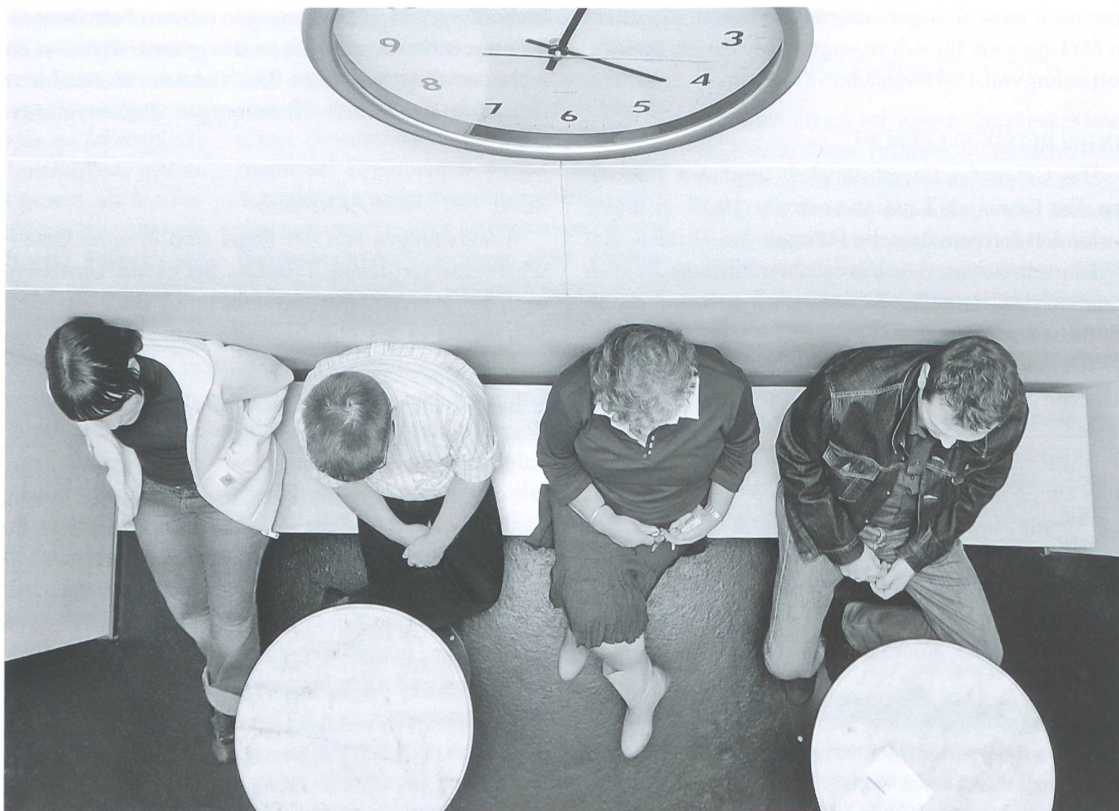
Ohne Risiko kein Erfolg in der Sozialhilfe: Klientinnen und Klienten sind aber darauf angewiesen.

Grundsätzlich gibt es vier unterschiedliche Strategien zur Steuerung von Risiken: