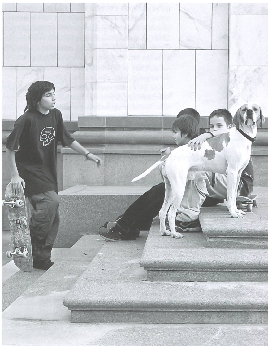
Achtung Kinder: In den meisten EU-Staaten sind sie überdurchschnittlich von Armut betroffen.

weise liegt dieser Anteil bei 9 Prozent, in Litauen hingegen bei 21 Prozent (s. Grafik S. 10). Im Vergleich zu anderen Regionen der Erde ist die Ungleichverteilung der Einkommen innerhalb der EU sehr moderat. Trotzdem hat der Durchschnitt der EU-Bevölkerung das Gefühl, dass in der persönlichen Umgebung jede dritte Person von Armut bedroht ist. Dass die Armutsrisikoquoten innerhalb der EU insgesamt so moderat ausfallen, ist zu einem grossen Teil auf eine erfolgreiche und flächendeckende Sozialpolitik zurückzuführen. So liegt die Armutsquote in der EU vor der Ausrichtung der Sozial->