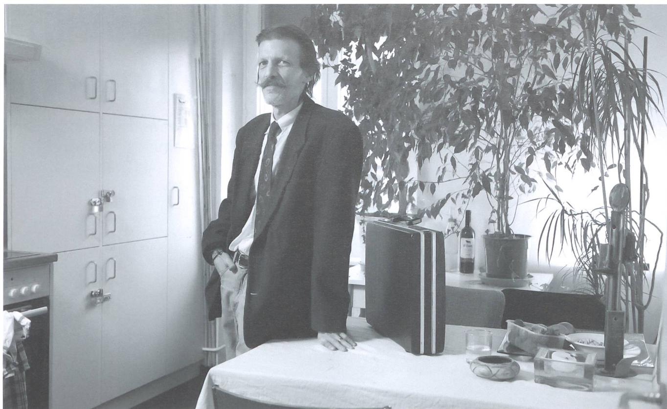
«Mein Krankenkassendossier wurde automatisch vom Sozialamt übernommen. Ich wurde nie gefragt.»