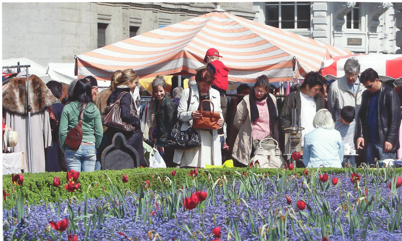
Die Risikogruppen haben sich wenig verändert. Ein Flohmarkt als Spiegel der sozialen Durchmischung der Bevölkerung.

Die für die Sozialhilfestatistik erhobenen Daten dienen sodann als Grundlage für die Erarbeitung von verschiedensten