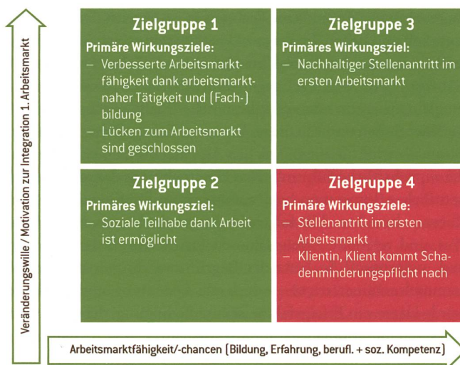
Motivation und Arbeitsmarktchancen entscheiden über die Zuteilung zu den Zielgruppen.

Die Programme erfüllen unterschiedliche Aufgaben. Personen der Zielgruppen 1 und 2 – Menschen mit geringen oder fehlenden Arbeitsmarktchancen – erhalten durch die Beschäftigungsprogramme eine Tagesstruktur und erleben soziale Teilhabe. Dies ohne den in vielen Fällen unrealistischen Anspruch auf eine Ablösung in den regulären Arbeitsmarkt. So wird Druck von diesen Menschen genommen, ohne sie aufzugeben. Ein Anspruch auf Ablösung in den ersten Arbeitsmarkt besteht hingegen für die Zielgruppen 3 und 4. Diese Klientinnen und Klienten erhöhen durch die Beschäftigung – die zwar im zweiten Arbeitsmarkt, aber unter realistischen Wettbewerbsbedingungen stattfindet – ihre Arbeitsmarktfähigkeit «on the job». In der Zielgruppe 3 – gute Chancen, hohe Motivation – lohnt es sich, in zusätzliche Qualifizierungsmassnahmen zu investieren. Durch Kurse in Grundkompetenzen sowie fachspezifische Aus- und Weiterbildungen erreichen Menschen in dieser Zielgruppe eine höhere Qualifikation. Sie verbessern so ihre Chancen auf dem ersten Arbeitsmarkt. Durch die Konzentration der Qualifizierungsmassnahmen auf jene Personen mit den besten Grundvoraussetzungen lässt sich der Wirkungsgrad