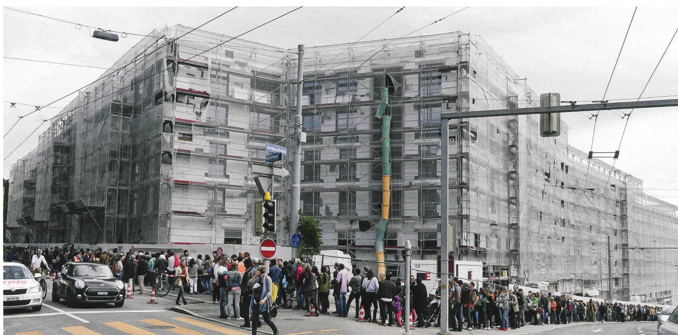
Wer eine attraktive und bezahlbare Wohnung will, muss heutzutage manchmal sehr lange suchen oder Schlange stehen.