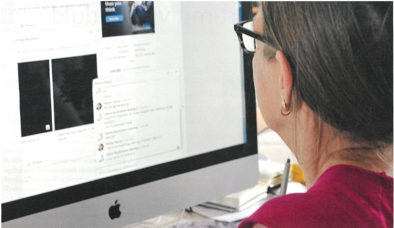
Die digitalen Kanäle bleiben ergänzende Angebote.