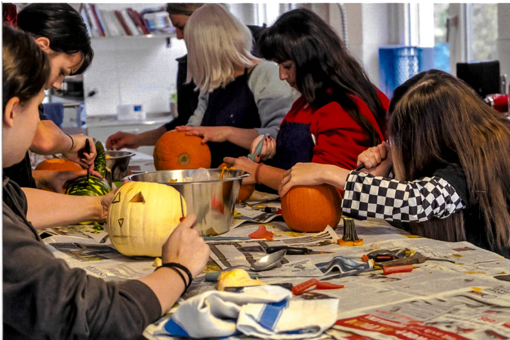
Gemeinsame Aktivitäten sorgen für eine tragende Struktur.