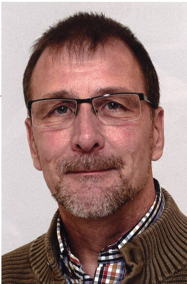
Harald Sohns ist Mediensprecher beim Bundesamt für Sozialversicherungen (BSV).