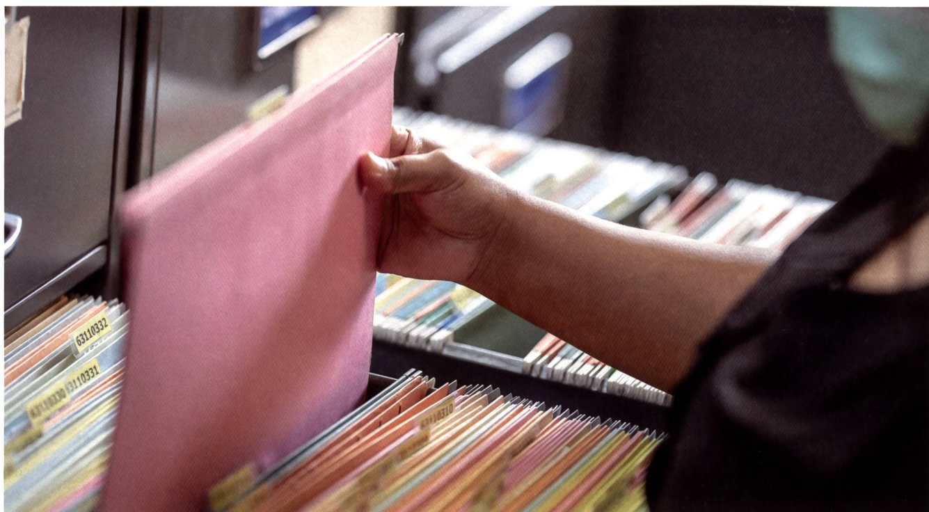
Anstelle der durchschnittlich 39 Fälle konnten nun 50 Fälle pro Monat von der Sozialhilfe abgelöst werden.

Mit der Senkung der Fallbelastung verringerten sich die durchschnittlichen monatlichen Fallkosten (der sogenannte Nettobedarf) um 75.50 Franken, was einer Reduktion um 3,6 Prozent entspricht. Mehreinnahmen ergaben sich namentlich in Form von Stipendien sowie bei den Kinderalimen-