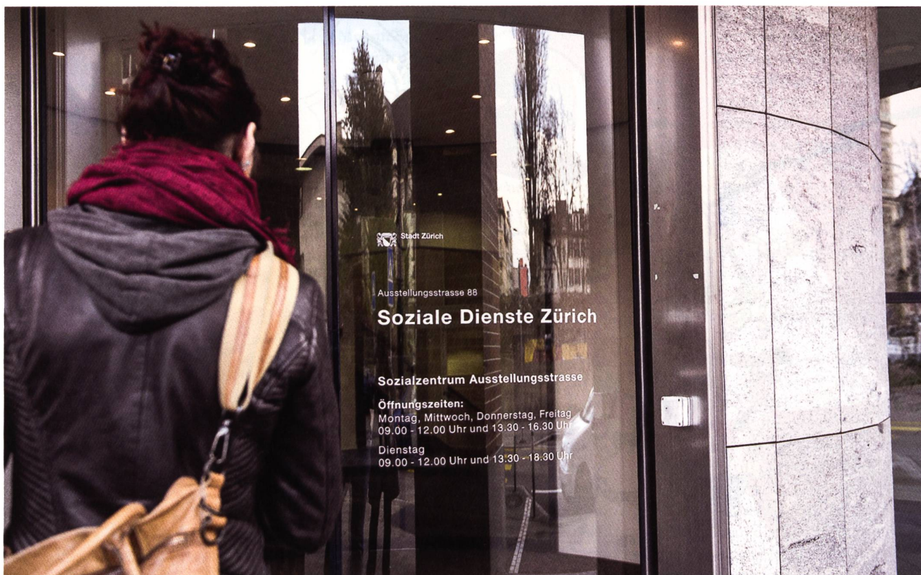
Die Meinungen zur Attraktivität der Sozialhilfe als Arbeitsfeld gehen sehr stark auseinander.

Zur Ermittlung der Attraktivität verschiedener Arbeitsfelder gaben 266 Studienabgänger auf einer Skala von 1 («sehr unwahrscheinlich») bis 5 («sehr wahrscheinlich») die Wahrscheinlichkeit an, mit der sie sich