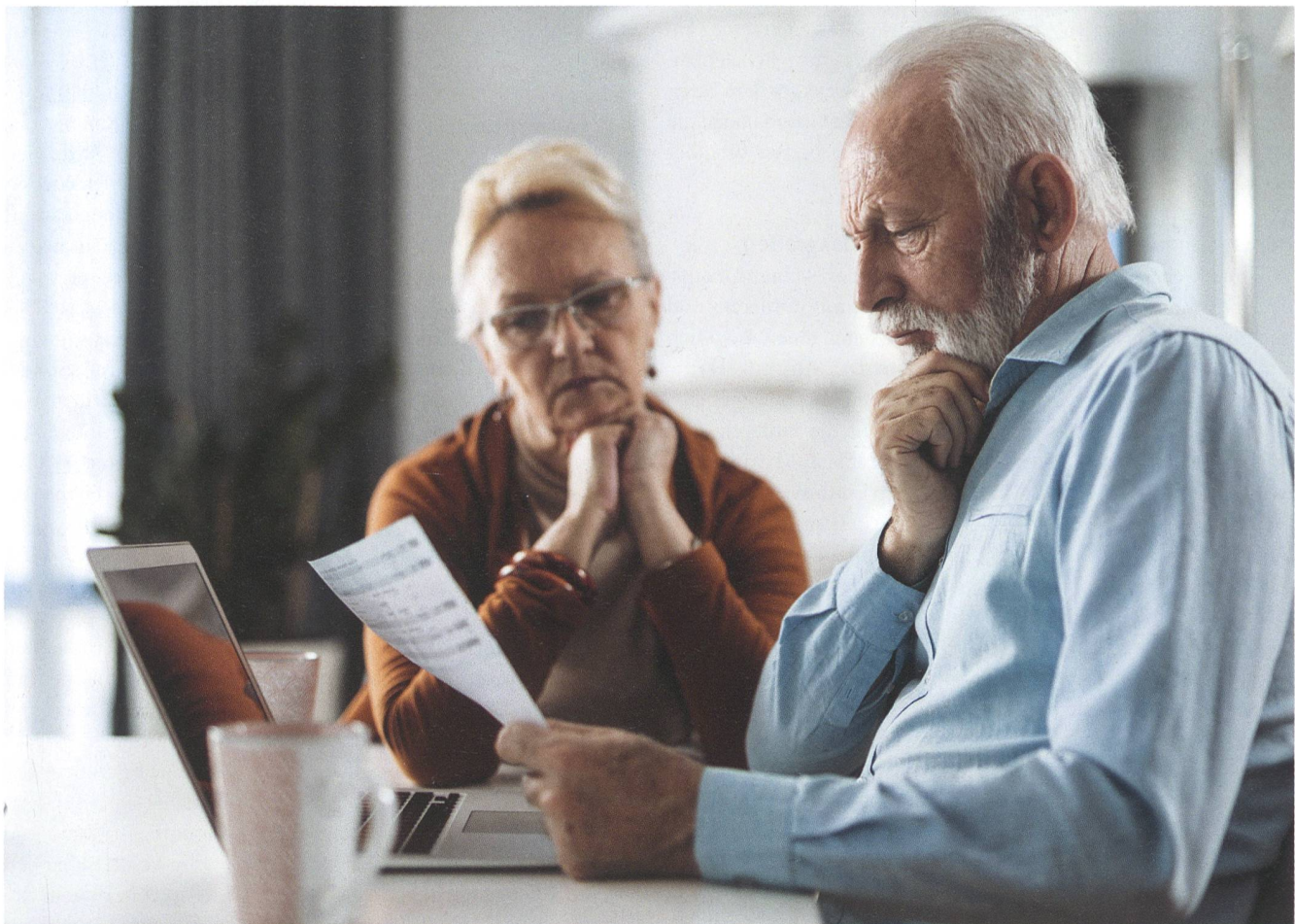
Die SKOS hatte gefordert, dass Langzeitarbeitslose bereits ab 55 Jahren Überbrückungsleistungen erhalten sollen.

Der Unterschied zwischen der Zahl der Personen, die im betreffenden Alter ihren Anspruch auf Arbeitslosigkeit verlieren, und der