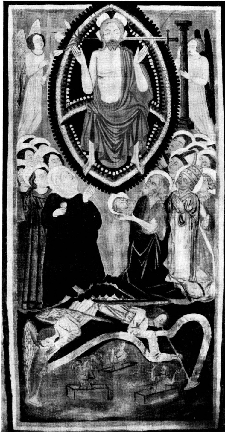
St. Benediktskapelle: Der Himmel.