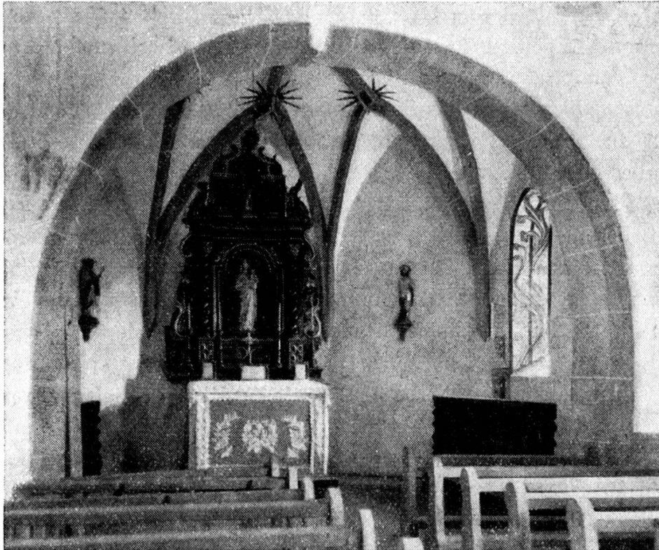
Chor der Benediktskapelle.

Erst im 15. Jh. scheint das Bedürfnis nach einer Dekoration des Kirchenschiffes rege geworden zu sein. Damals malte nämlich ein Künstler — es war wohl ein Italiener — auf die Rückwand ein letztes Gericht und belegte damit die ganze Fläche, die nicht von der Türe beansprucht wurde. Als Ganzes ist es eine sehr interessante Darstellung, weil die Türe den Künstler zwang, die Szene in zwei scharf geschiedene Gruppen zu teilen. Für den Eintretenden ist rechts der