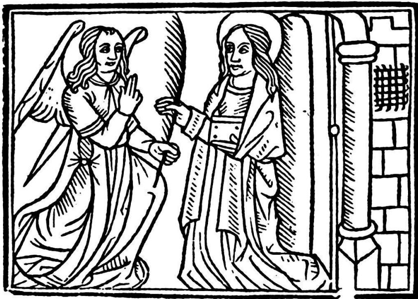
Constitutions de 1494, v o du feuillet du titre.

Incipiunt cōstitutiones synodales ecclesie z Episcopatus Lausannēsis. Per plures z diuer- sos presules lausannēsis edite. Et per reuerēn. in cristo patrē dominum Georgium de salucijs Ep̄m et comitē Lausannēsis cōpilare et in vñū volumen redacte. et demū. Per reuerēdissimuz In xp̄o p̄rem z dominū. Dnm Aymonē de mō te falcone dei gr̄a. presulem principē et comitez lausannēn. modernū cōfirmate et approbate. Ac de eius mādato impresse.