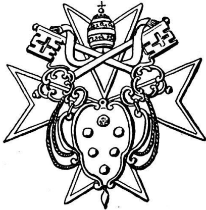
ill. 1. Revers d'une médaille du pape Clément VII (1523-34), d'après D. L. Galbreath.

On peut donc dire que la simple croix droite qu'on voit sur les sceaux des premiers maîtres avait pris, déjà sur les monnaies frappées à Rhodes,