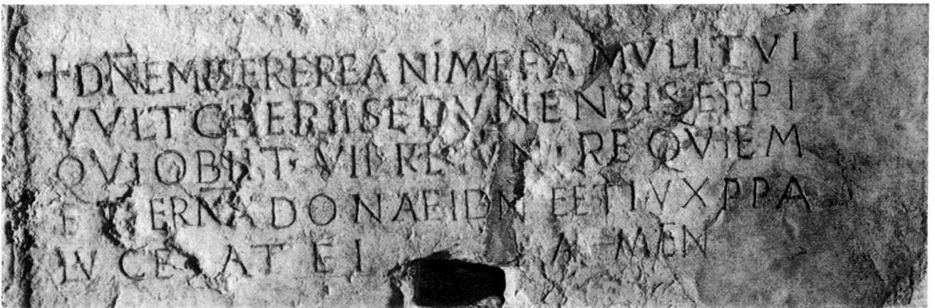
Abb. 2: Ausschnitt von Abb. 1.