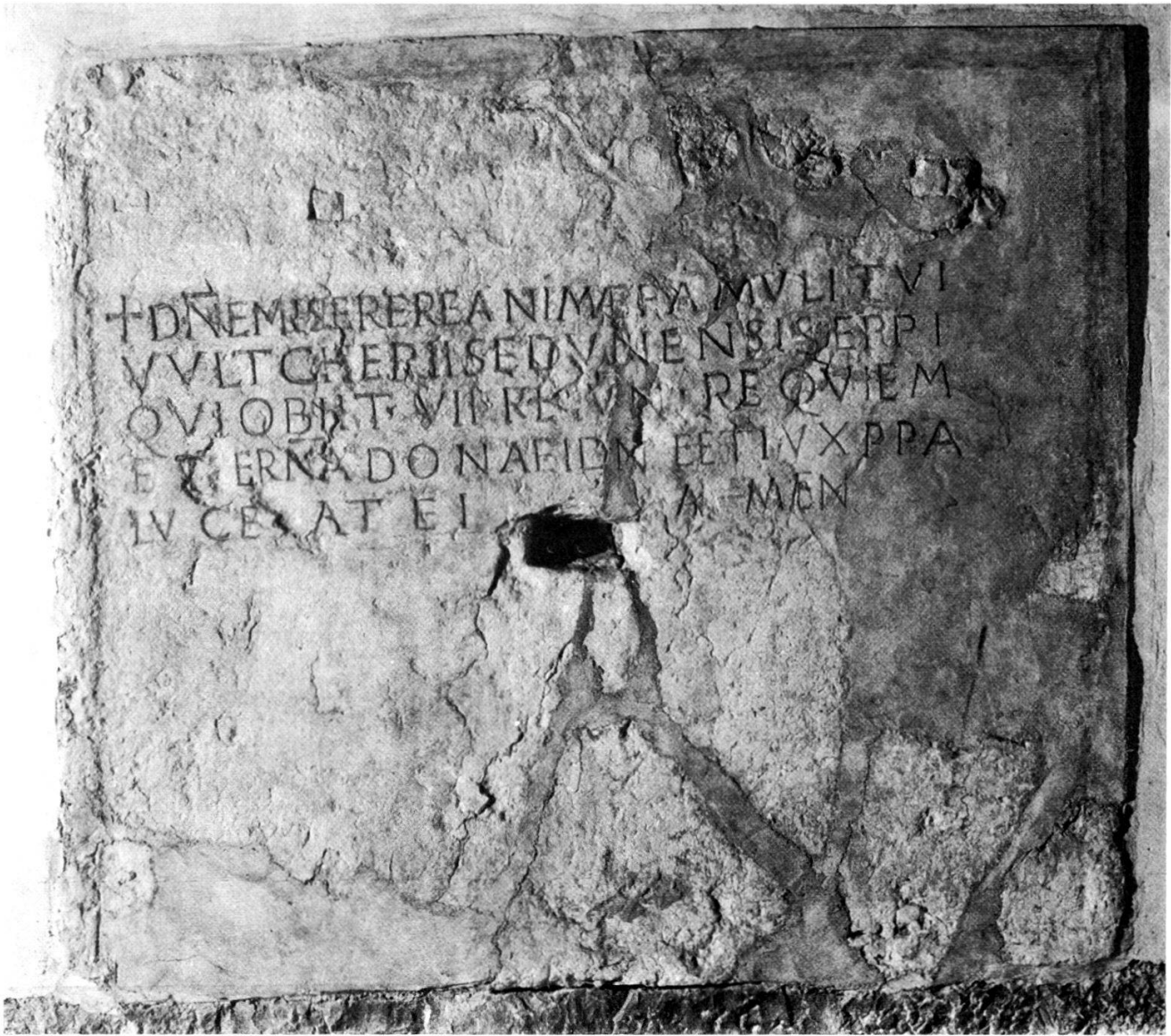
Abb. 1: Grabinschrift des Bischofs Vultcherius von Sitten, St-Maurice, Chapelle des Saints-Abbés.