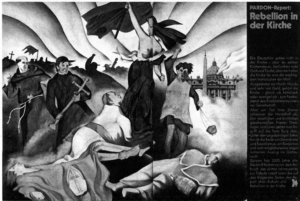
Abbildung 7: Pardon 12/1969