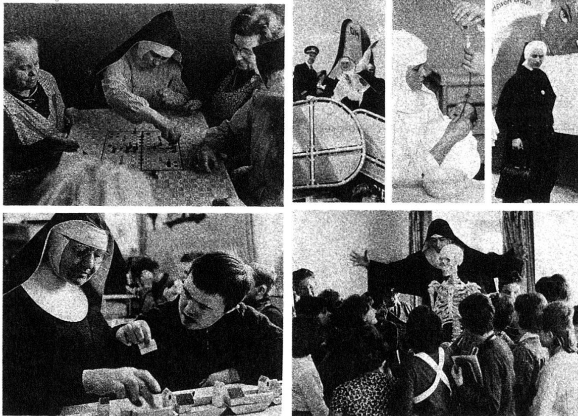
Abbildung 6: magnum 58/1966